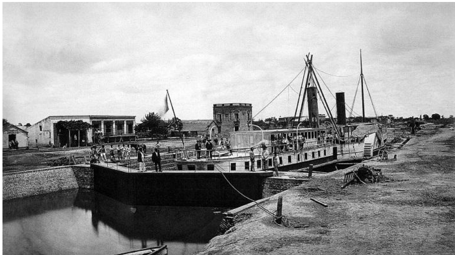
El Puerto de San Fernando y su Dique Seco de Carena en la segunda mitad del siglo XIX

Las posibilidades de San Fernando como sede de las autoridades provinciales no pasaron de una simple propuesta, la idea de una personalidad ilustrada y progresista que creyó ver en ello una gran posibilidad de desarrollo para su pueblo de adopción.