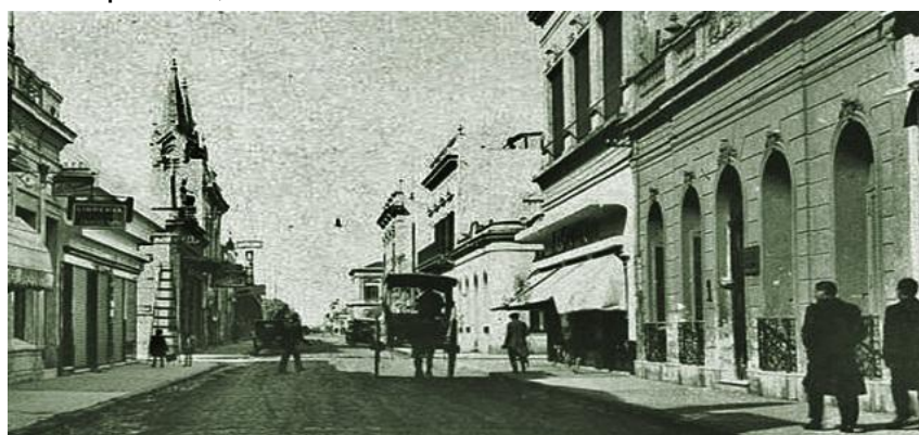
Calle Constitución vista desde el sur. La imagen es posterior a 1905 pues la iglesia presenta su fachada actual

Pocos, por no decir nadie en San Fernando, conocen este hecho. Tampoco nosotros hasta que un amigo nos acercó la información. Sirva como dato, para acrecentar la rica historia de nuestro distrito, en especial, la de su ciudad cabecera.