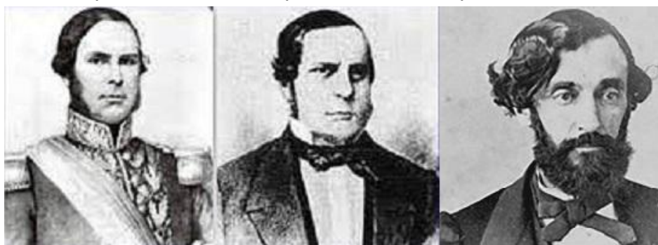
Justo José de Urquiza, Santiago Derqui y Bartolomé Mitre figuras emblemáticas de un período conflictivo