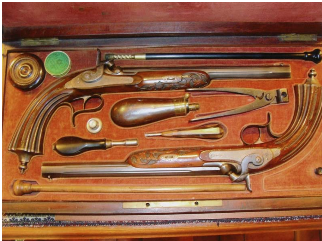
Caja con pistolas de duelo y accesorios, S. XIX, colección particular.