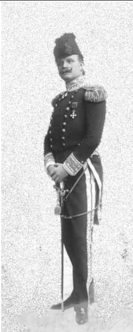
Carlos de Morra, Archivo Histórico de la Sociedad Central de Arquitectos