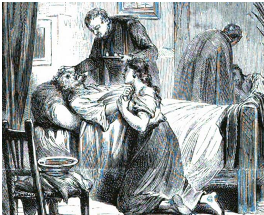
En 1867 el cólera hizo estragos en Buenos Aires

hojas de doble filo y punta muy aguda con la que se practicaban los cortes, las vasijas donde se vertía la sangre, morteros para los preparados, pinzas para las extracciones, sierras con las que efectuaba las amputaciones, tijeras, agujas, diversos recipientes, en especial frascos, bandas de goma o tela para aplicar torniquetes, apósitos, vendas, algodón y en un lugar especial, las sanguijuelas, tan necesarias en esas prácticas.