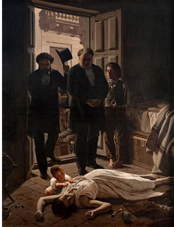
La epidemia de fiebre amarilla en el célebre cuadro de Blanes

Su labor fue ímproba, no solo asistiendo a los contagiados en los centros de atención, habilitados expresamente, sino acudiendo a sus domicilios y hasta trasladándolos en su carruaje, que en situaciones extremas condujo personalmente.