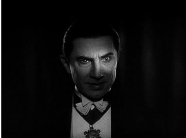
Bela Lugosi en la magistral producción de 1931