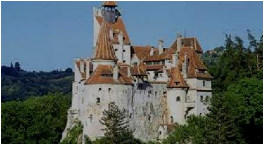
Castillo de Bran

El verdadero castillo de Drácula se encuentra en Poenari, localidad de Valaquia, a 151 kilómetros del punto anterior, en dirección oeste, también en los montes Cárpatos. Se trata de una derruida fortificación medieval, construida sobre un acantilado casi por la misma época que los cruzados levantaron el baluarte teutónico, destruido un siglo después.