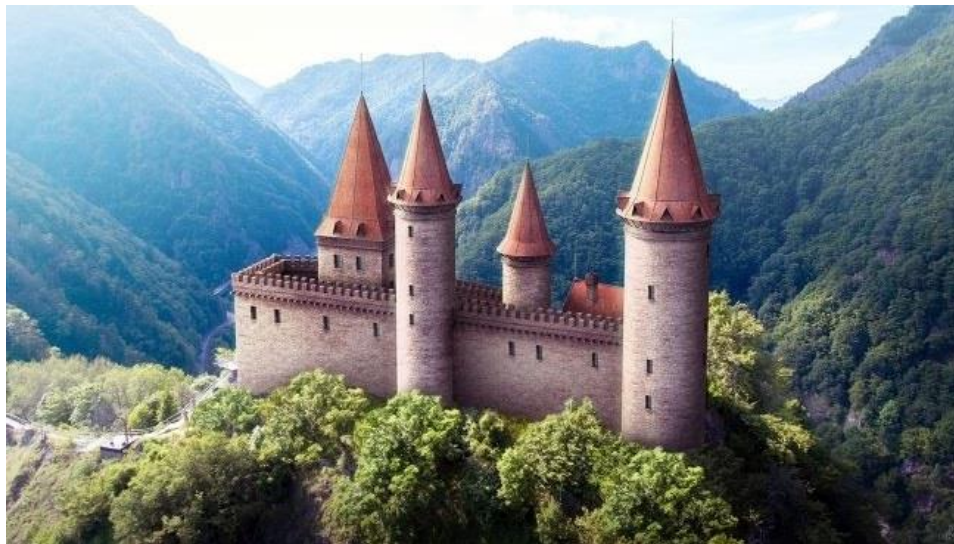
El bastión en tiempos de Drácula