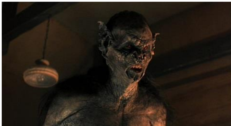
El terrorífico vampiro de la entrega de Francis Ford Coppola

( Drácula de Bram Stoker , Columbia Pictures, 1992)