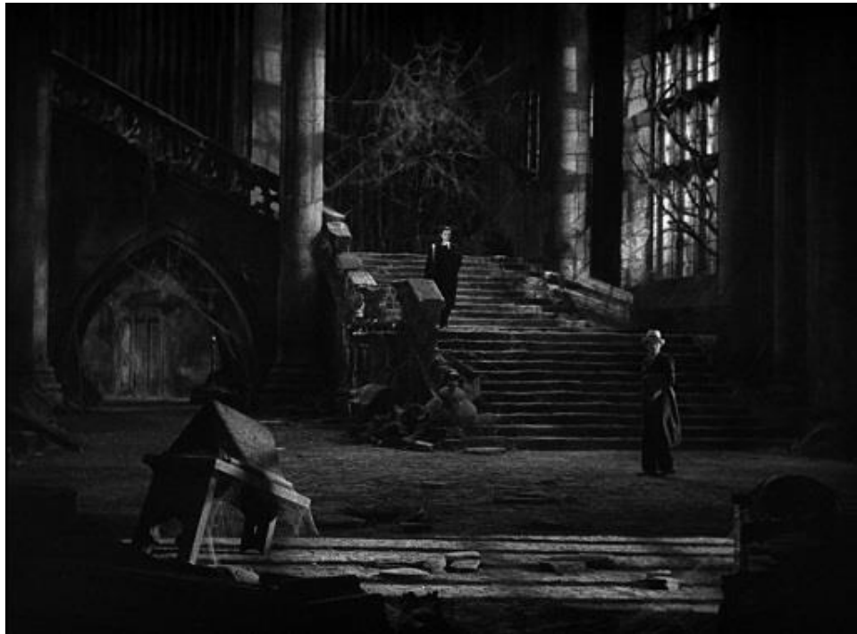
Interior del castillo de Drácula en la película de 1931