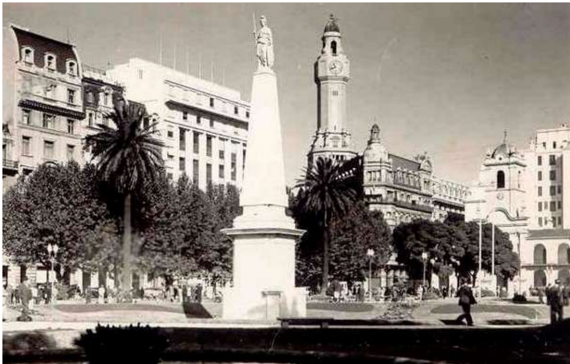
Anexo 9 – La Pirámide de Mayo sin estatuas