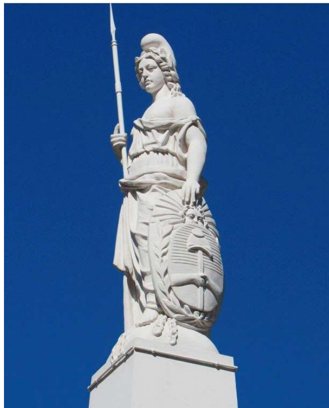
Anexo 7 – La Libertad