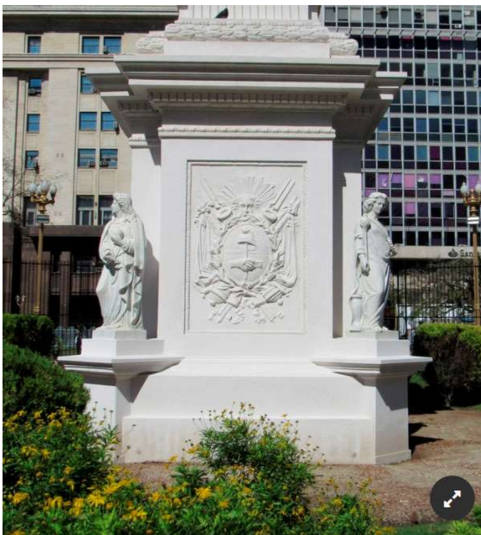
Anexo 14 – Las estatuas instaladas