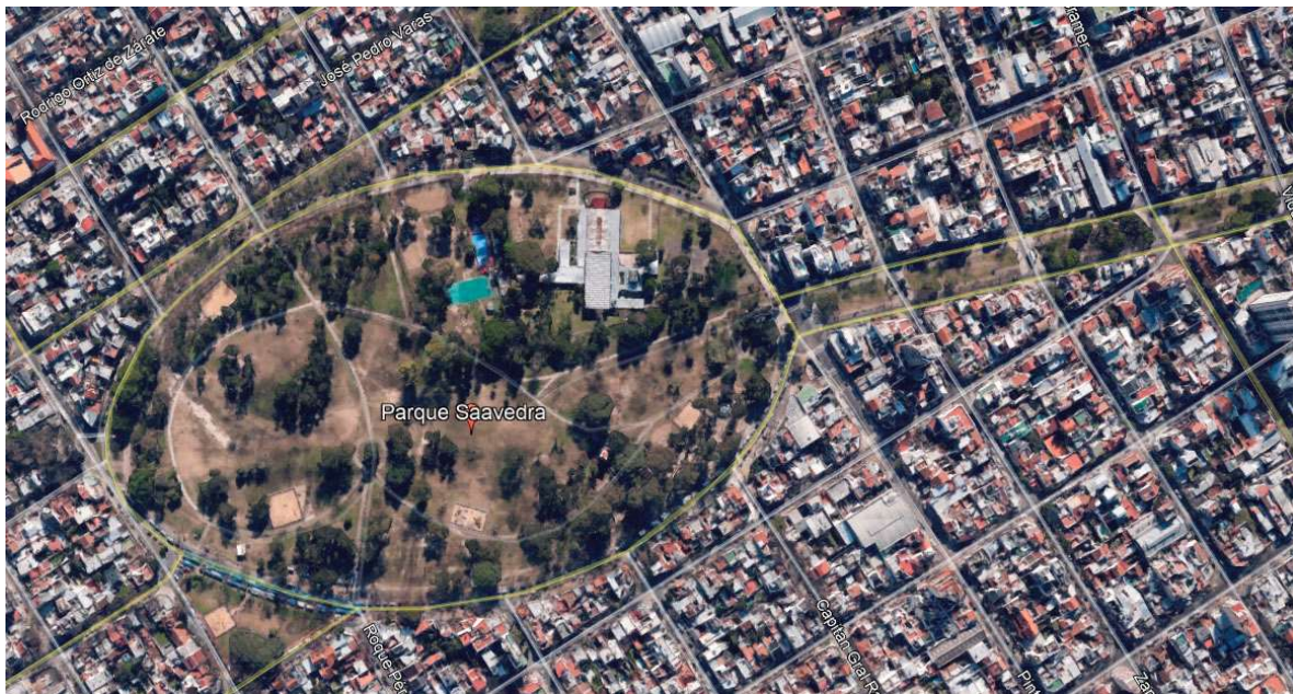
Anexo 5 – La isla en la actualidad con el arroyo Medrano entubado