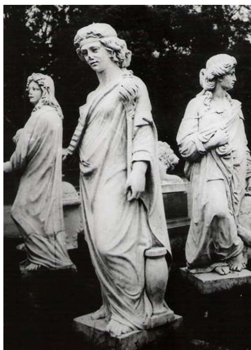
Anexo 10– Tres de las estatuas en los depósitos municipales