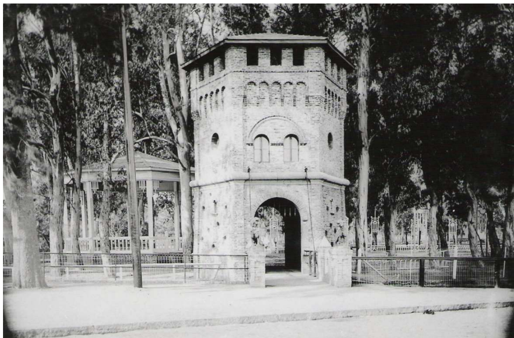
Anexo 2 - La entrada al parque con su castillo medieval y su puente levadizo