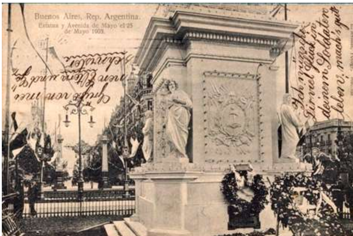
Anexo 8– La Pirámide de Mayo con las estatuas colocadas por Prilidiano Pueyrredon en 1857