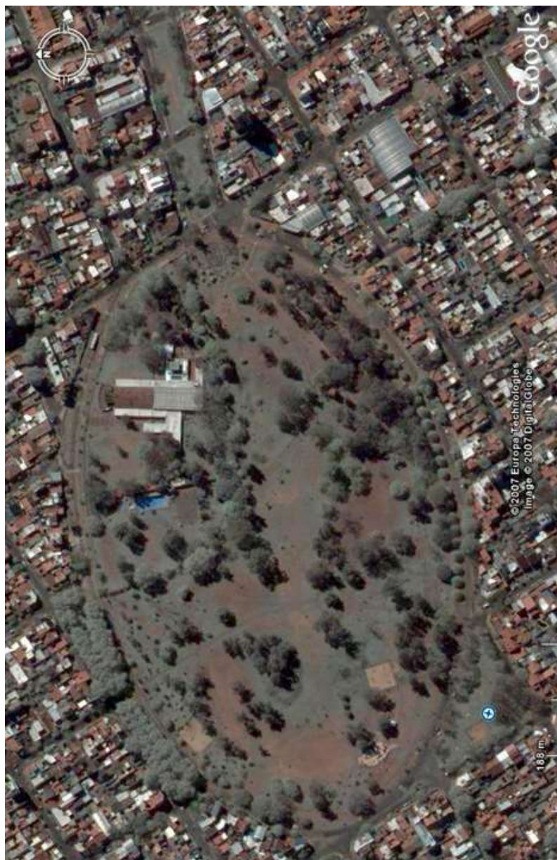
Anexo 19 – La Plaza Saavedra en la actualidad