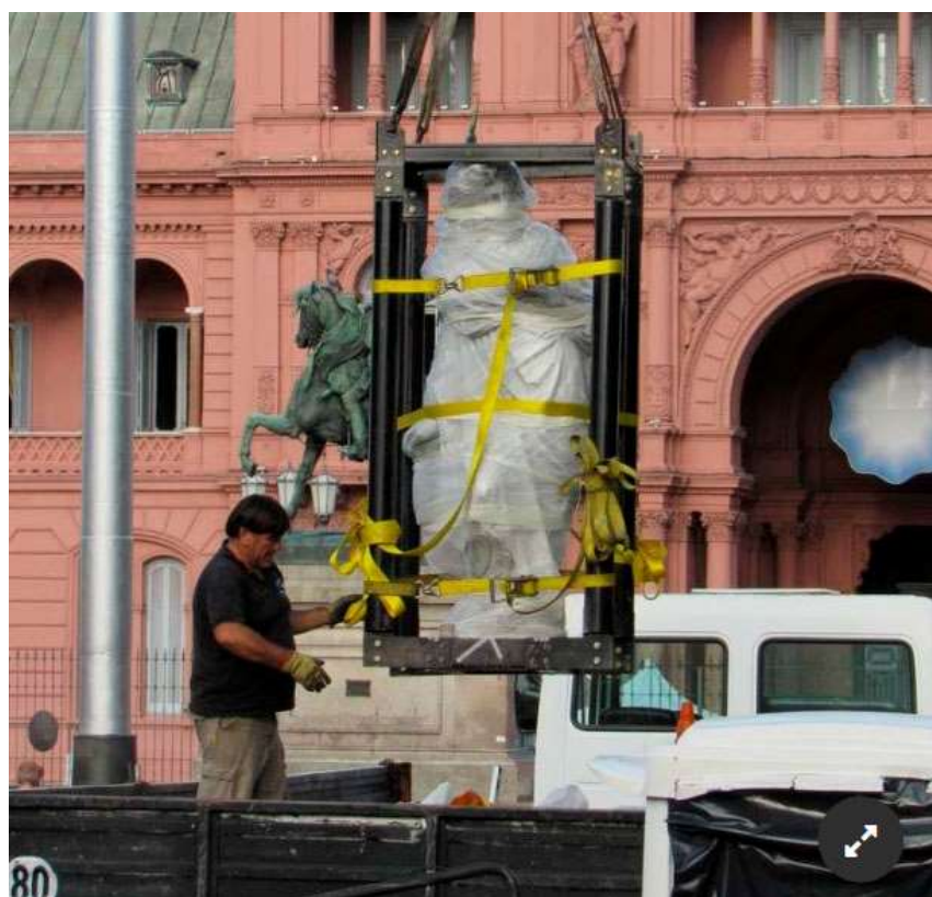
Anexo 12 – El traslado de una de las estatuas