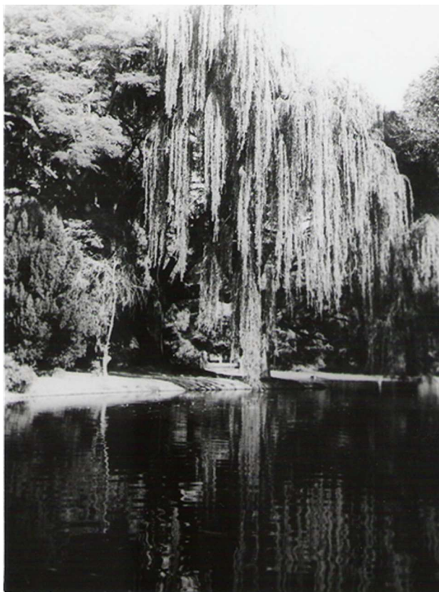
Anexo 18 – Un rincón del lago