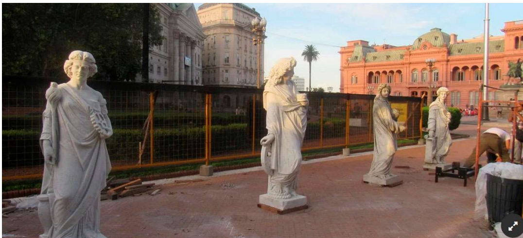
Anexo 13 – Las cuatro estatuas listas para ser instaladas en la Pirámide