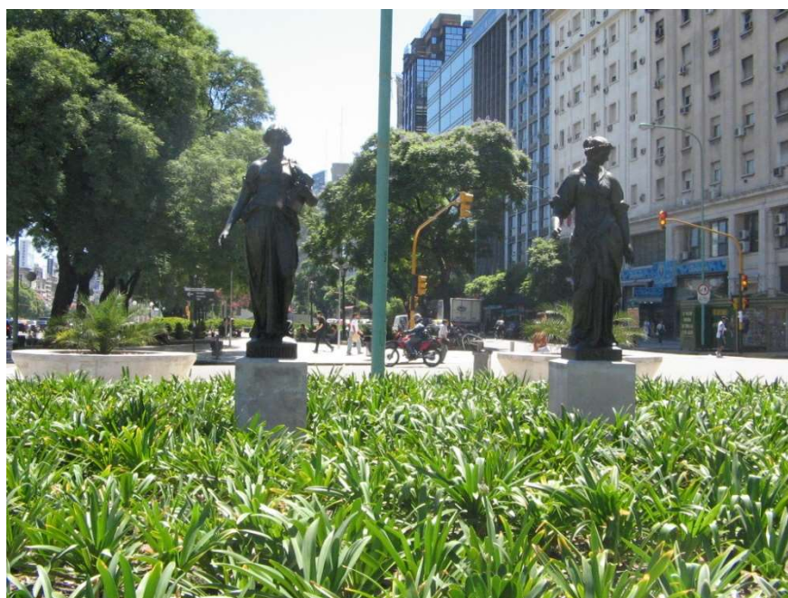
Anexo 16 - La Sabiduría y La Virtud ubicadas actualmente en una plazoleta de la 9 de Julio