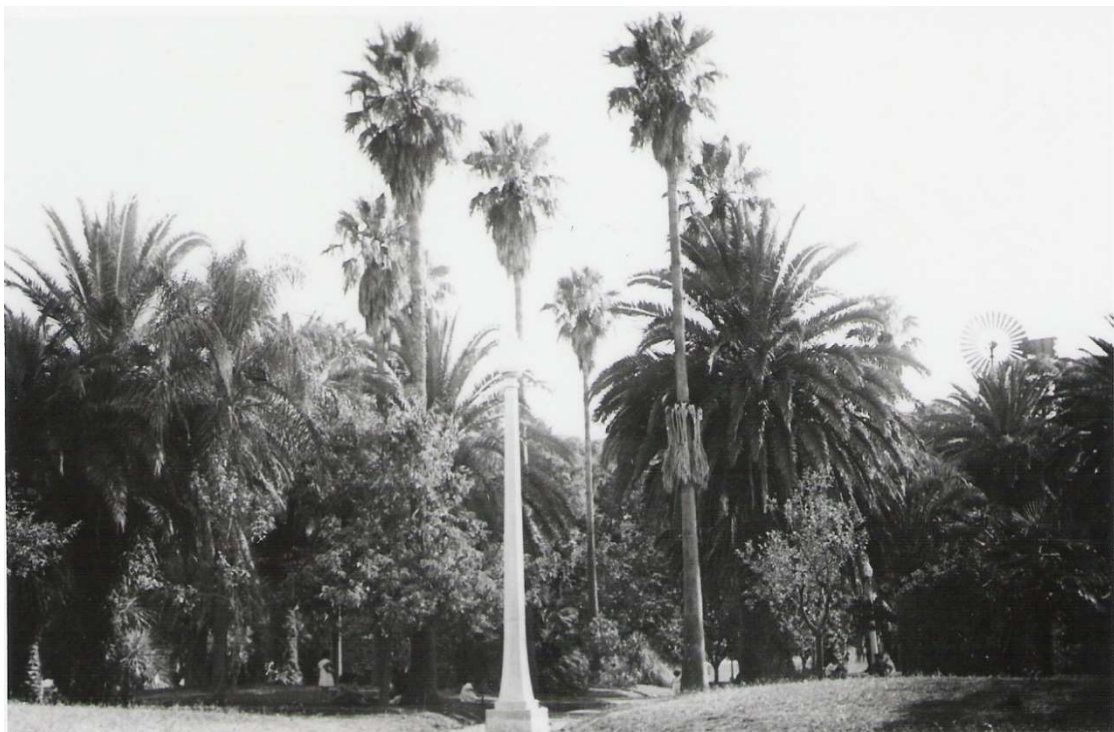
Anexo 17 – Un sector de la espléndida arboleda que tenía el parque