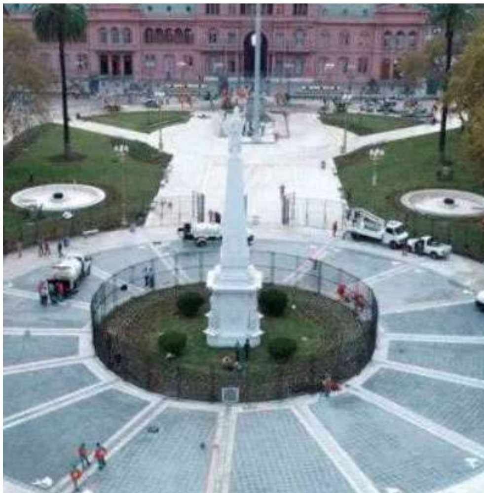
Anexo 15 – La Pirámide de Mayo y su actual reja de protección